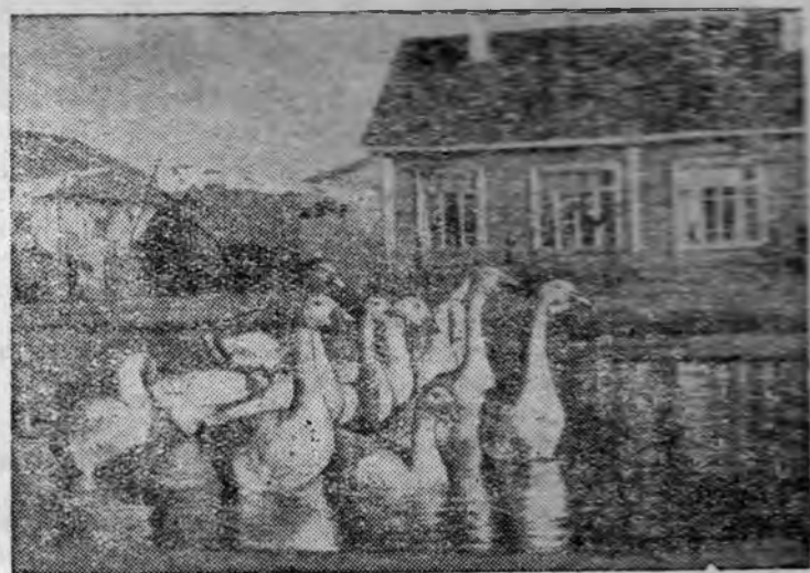
Уголок птицефермы пригородного хозяйства у гор. Александровска-Сахалинского.

Недавно в Ленинском свиноводхозе состоялся выпуск неграмотных и малограмотных, обучавшихся в вечерней школе, 28 рабочих и домохозяйек совхоза получила образование за начальную школу и 26 человек ликвидировали свою неграмотность.