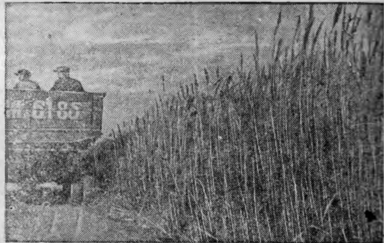
Рожь на полях колхоза имени Челюскинцев (Сталинская область).